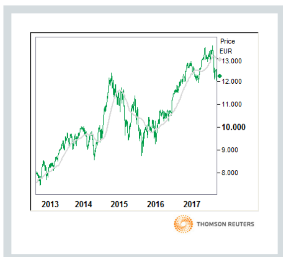
DAX (Kurs und 90 Tage moving average)