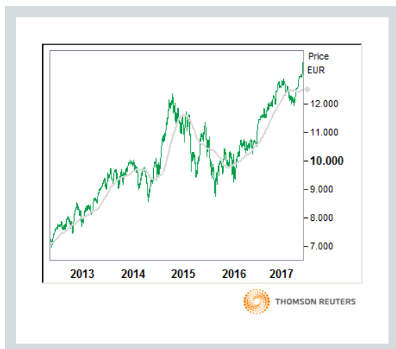
DAX (Kurs und 90 Tage moving average)