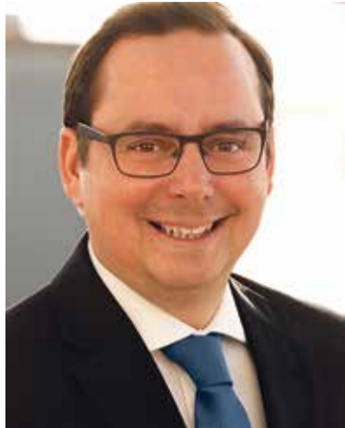
Essens Oberbürgermeister Thomas Kufen

die Entscheidung ist gefallen. Die 3,5 Meter hohe Skulptur „Uranos“ des Künstlers Markus Lüpertz bekommt einen neuen Ausstellungsort: den Theaterplatz, mitten im Herzen der Essener Innenstadt. Im Herbst des vergangenen Jahres erstmals im Museum Folkwang präsentiert, hat das beeindruckende 800 Kilo schwere Kunstwerk zwischen dem Grillo-Theater und der NATIONAL-BANK nunmehr seinen endgültigen Standort im öffentlichen Raum gefunden. Darüber freue ich mich. „Uranos“ symbolisiert den Abschied vom Steinkohlebergbau und ist deshalb bezeichnend für Vergangenheit und Zukunft unserer Stadt. Dasselbe gilt für den Künstler Markus Lüpertz, dessen familiäre Herkunft untrennbar mit dem Ruhrgebiet verbunden ist. Kunst im öffentlichen Raum ist wichtig und für das gesellschaftliche Zusammenleben unverzichtbar. Das gilt besonders in Zeiten, in denen die Diskussion über die Werte, die unsere Gesellschaft zusammenhalten, an Bedeutung gewinnt. Kunst im öffentlichen Raum soll aber zugleich Weg-