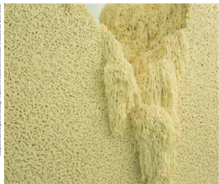
GEREON KREBBER – antagomorph 30. September 2016 bis 5. März 2017 Museum DKM, Duisburg