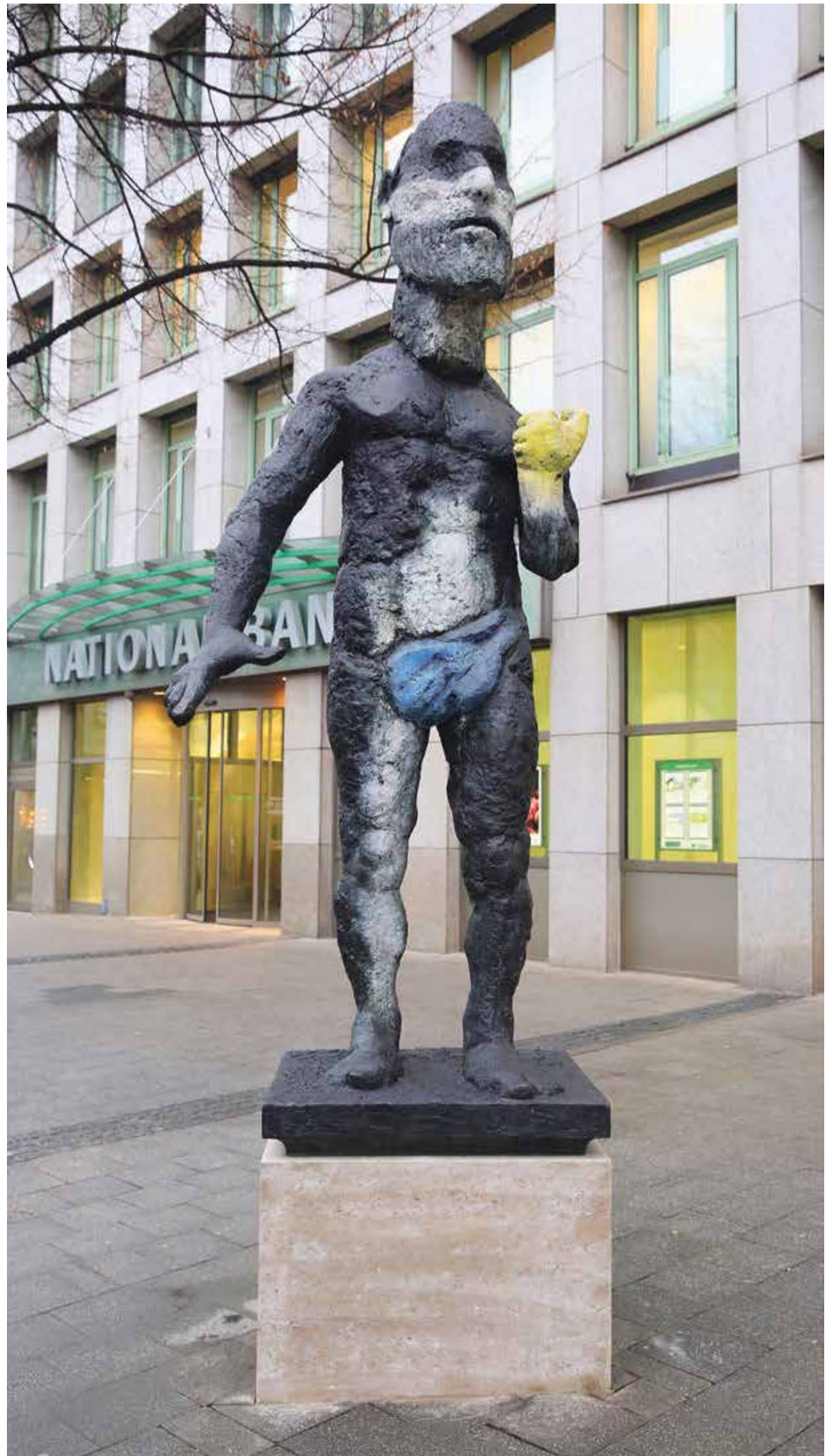
Ein Gott für den Theaterplatz: Markus Lüpertz' „Uranos“ hat seine Heimat gefunden