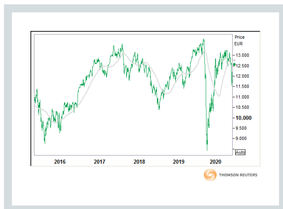
DAX (Kurs und 90 Tage moving average)