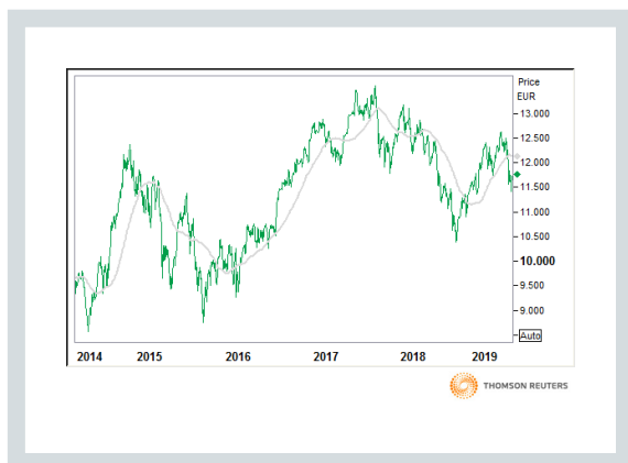
DAX (Kurs und 90 Tage moving average)