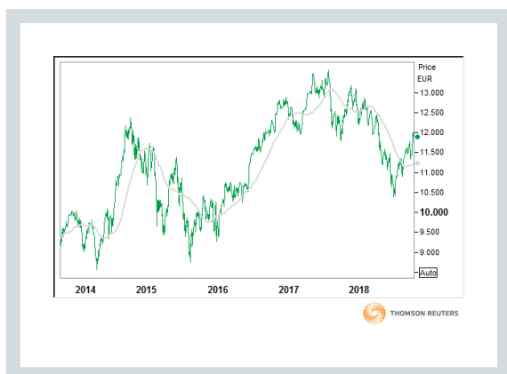
DAX (Kurs und 90 Tage moving average)